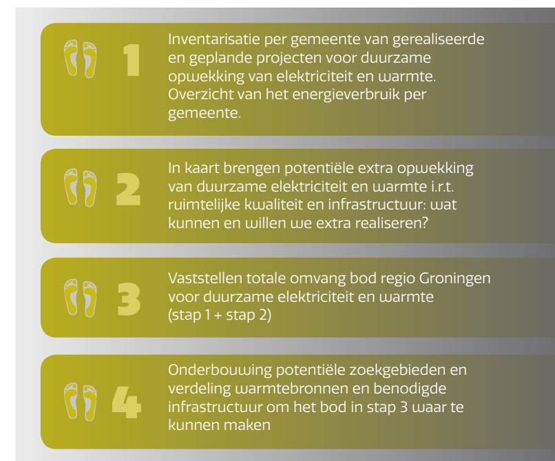
FIGUUR 5: STAPPENPLAN GRONINGS BOD

Figuur 5 geeft de stappen weer om in Groningen tot een gezamenlijk RES-bod te komen. De stappen 1 en 2 zijn iteratief. In deze stappen worden bestaande projecten, geplande projecten en (beleids)plannen van duurzame opwekking van elektriciteit en warmte opgeteld. Ook wordt per gemeente een overzicht gegeven van het (verwachte) energieverbruik (stap 1). Daarna volgt een analyse van wat additioneel mogelijk en gewenst is. Dit is de belangrijkste input om in stap 3 tot een gezamenlijk bod van de regio Groningen te komen. Tot slot wordt het bod onderbouwd en uitgewerkt naar 'potentiële zoekgebieden' tot de uiteindelijke concept RES (stap 4). Uiterlijk juni 2020 wordt de concept RES ingediend bij het Nationaal Programma RES.