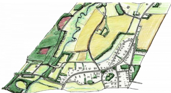
Spinnenwebstructuur bij Onstwedde

Een mooi voorbeeld van de esdorp-opbouw is het dorp Onstwedde. Kenmerkend voor dit dorp is de ligging aan de rand van het beekdal van de Mussel Aa en het spinnenwebachtige patroon van wegen en paden. Vanuit het centrum, met vaak een verruiming van de openbare ruimte (de brink), lopen wegen naar de verschillende onderdelen van het dorp. Deze wegen vinden hun oorsprong in het bewerken van het land: ze verbonden vroeger het bouwland, de weiden en de woeste gronden met elkaar. Lange tijd bestonden deze wegen nog uit zandpaden. Een duidelijke hiërarchie in wegen ontbreekt en het verloop is vaak zeer bochtig. Aan de Juffertoren van Onstwedde is een sage verbonden die de naam van de toren herleidt. Er waren oorspronkelijk vier Juffertorens in Groningen, alleen die van Onstwedde en Schildwolde bestaan nog. Ze karakteriseren zich door de volledig uit baksteen opgetrokken toren en spits.