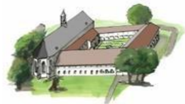
Kloostercomplex Ter Apel

Een belangwekkend cultuurhistorisch ankerpunt in de zuidpunt van het esdorpenlandschap van Westerwolde vormt het klooster van Ter Apel dat in 1464 door de Kruisheren is gesticht. Het kloostergebouw heeft na de Reductie gediend als voorpost voor de stad Groningen, de toenmalige eigenaar van de Heerlijkheid Westerwolde, en is grotendeels bewaard gebleven.