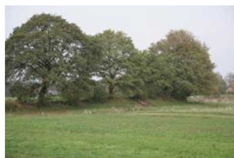
Es met steilranden bij Sellingeren