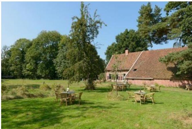
Theehuis te Smeerling, voorbeeld kop-romp type

Naast dat het ontgonnen land voor agrarisch gebruik werd ingericht, werden met name bij Sellingen in de jaren '30 tot en met '50 van de 20 ste eeuw bossen geplant op de heidevelden.