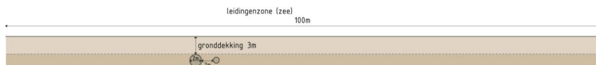
Figuur 3. Doorsnede buizenzone op zee

In verband met de dynamische omstandigheden (veroorzaakt door zeestromingen), wordt in dit MER aangenomen dat de leidingen buitendijks meer dan 1 meter uit elkaar moeten liggen. De fysieke zone wordt daardoor ook breder dan 50 meter. In dit MER wordt er vanuit gegaan dat de fysieke zone waarin de leidingen liggen minimaal 100 meter breed is. Deze 100 meter zone komt overeen met de zone die in de POV is opgenomen als ruimtelijke reservering. Buitendijks wordt uitgegaan van minimaal 3 meter gronddekking. Dit geldt zowel voor de zandplaat Hond en Paap als voor de vaargeul (Bocht van Watum).