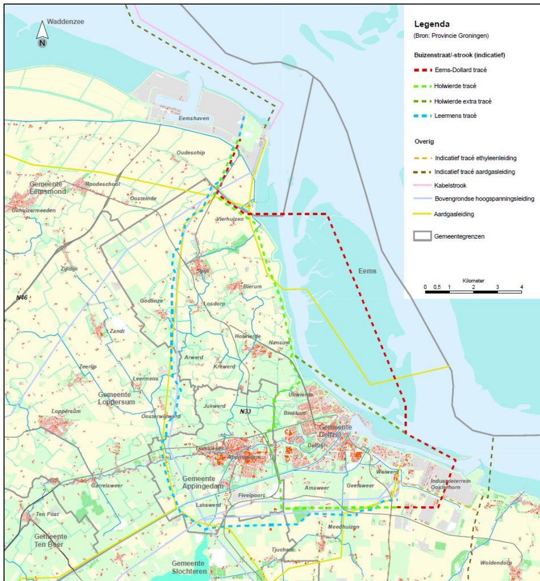
Afbeelding 1. Tracés buizenzone

Tussen de Eemshaven en industrieterrein Oosterhorn Delfzijl is een buizenzone gepland waarmee beide industriële complexen met elkaar worden verbonden. De bedoeling is dat in deze buizenzone toekomstige ondergrondse leidingen tussen de Eemshaven en Oosterhorn Delfzijl worden gebundeld. Voor deze buizenzone is in het Provinciaal Omgevingsplan 2009 – 2013 een drietal mogelijke tracés opgenomen (Leermens, Holwierde en Eems-Dollard). Nadien is een extra variant op één van deze tracés aan deze alternatieven toegevoegd (Holwierde Extra). In de onderstaande afbeelding is de ligging van de tracés weergegeven.