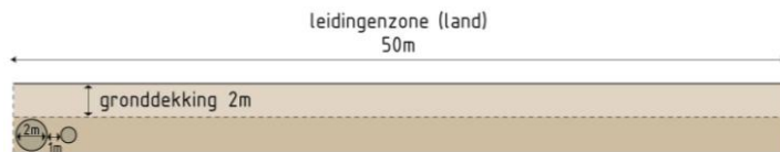
Figuur 2. Doorsnede buizenzone op land

Omgevingsverordening is aangemerkt als ruimtelijke reservering (dit geldt niet voor het N33-trace),. Voor de diepteligging van de leidingen wordt uitgegaan van een gronddekking van ten minste 2 meter in agrarisch gebied.