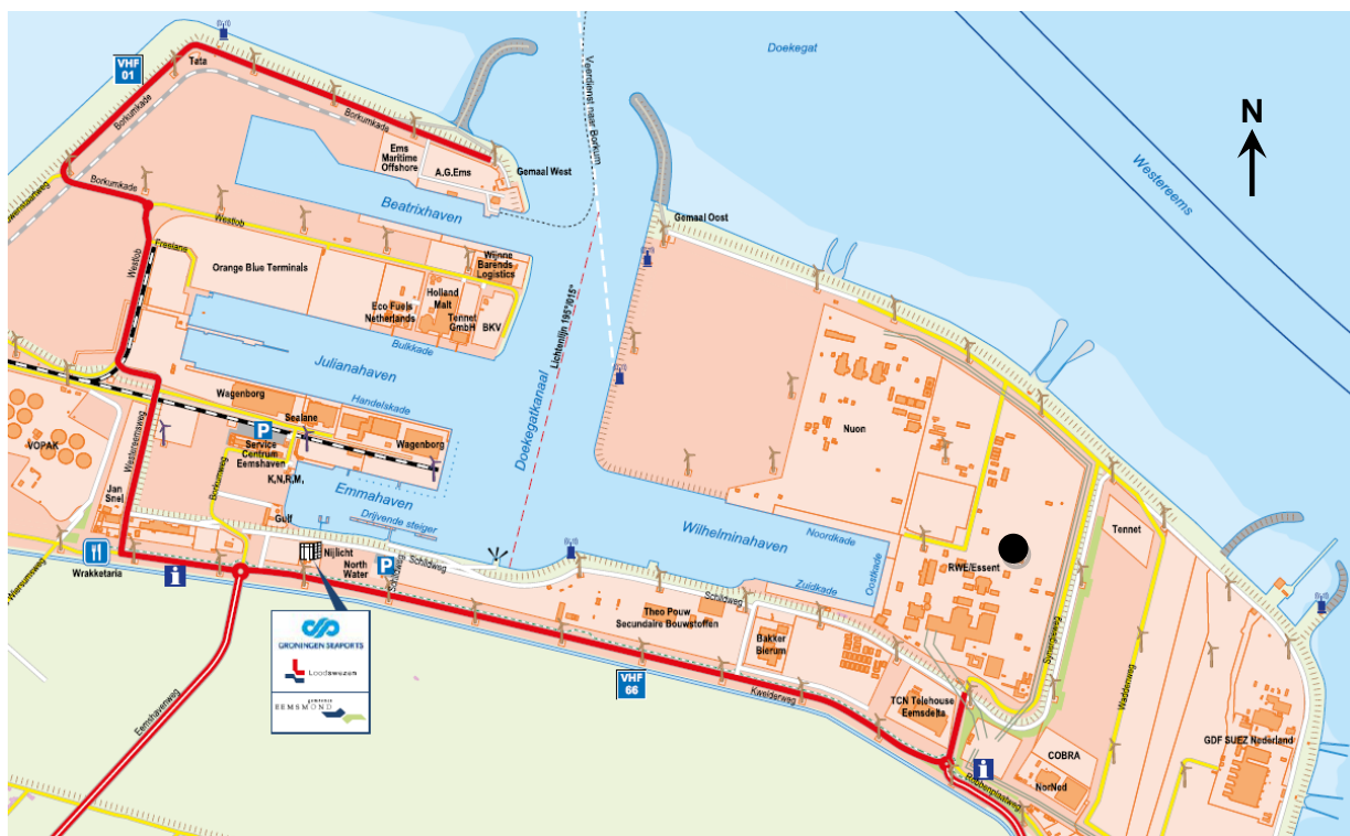
Figuur 2 Locatieschets van de Centrale in de Eemshaven (zie cirkel)

De ligging van de Centrale is weergegeven in figuur 2.