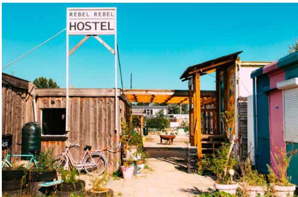
REBEL REBEL HOSTEL |

De provincie Groningen is projectpartner en draagt inhoudelijk en financieel bij (€ 300.000,- uit diverse budgetten) aan dit meerjarenproject (2020-2024). Doel is het vernieuwen van opleidingen in de gastvrijheidssector, zodat ze beter aansluiten bij de eisen van het bedrijfsleven. Bedrijven en instellingen worden intensiever betrokken bij onderwijsontwikkeling. De laatste jaren neemt het aantal studenten dat voor het vakonderwijs kiest af, mede door de coronacrisis. Die trend willen we samen met de projectpartners doorbreken. We zetten daarbij in op het verbeteren van de aansluiting tussen onderwijs en arbeidsmarkt én het vergroten van de gastvrijheid door scholing van docenten, studenten en werkenden in de sector.