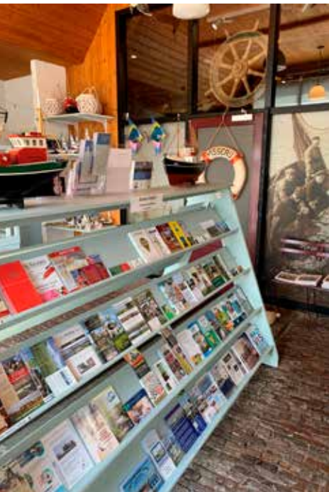
TOERISTISCHE INFORMATIE IN HET VISSERIJMUSEUM ZOUTKAMP