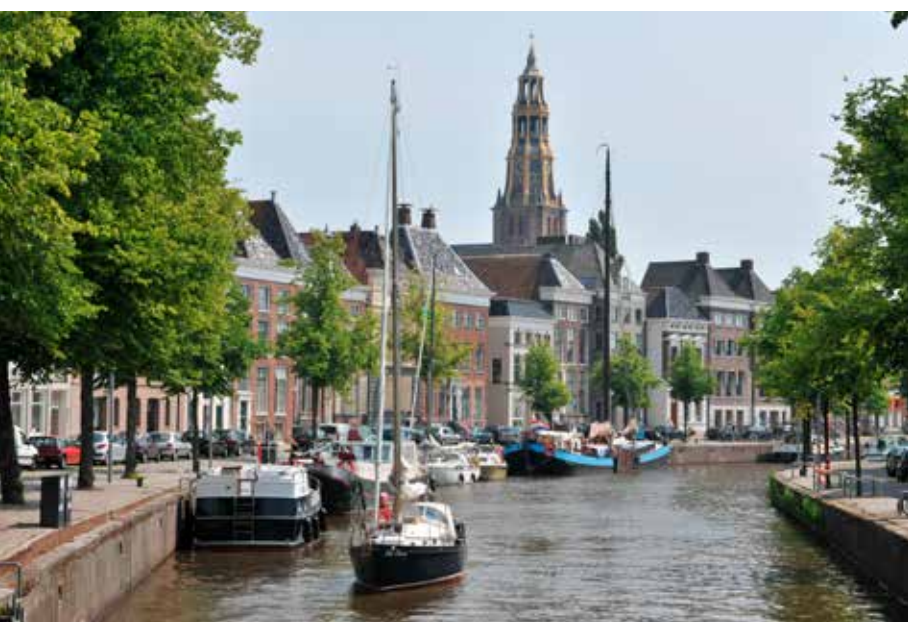
HOGE DER AA