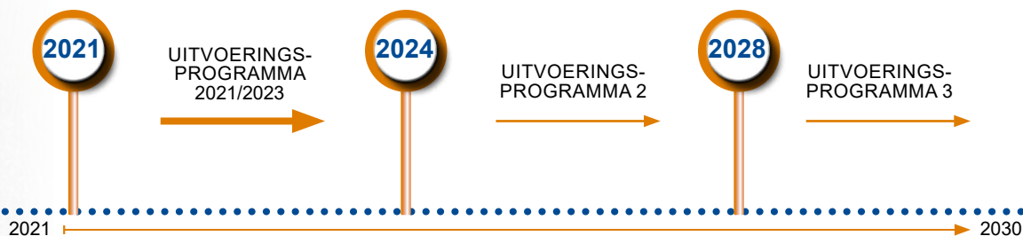
Tijdspad Strategische Visie Vrijtijdseconomie 2021-2023

In dit uitvoeringsprogramma bekijken we allereerst terug op de visie, de ambities en de strategische opgaven. We behandelen onze rol als provincie in een door de markt gedomineerd beleidsveld. Per opgave benoemen we daarna de in te zetten acties gedurende de periode 2021-2023. Vervolgens gaan we in op de samenwerking en koppelkansen met andere beleidsvelden, programma's en regelingen. Ook behandelen we het monitoren van de acties. We besluiten met de begroting van het uitvoeringsprogramma.