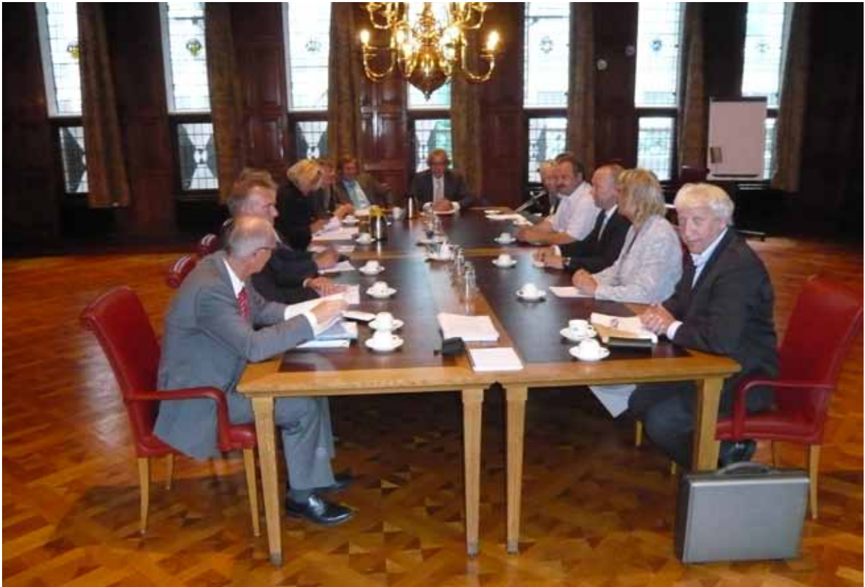
Overleg met de gemeente Groningen en de DEAL-gemeenten over de organisatievorm