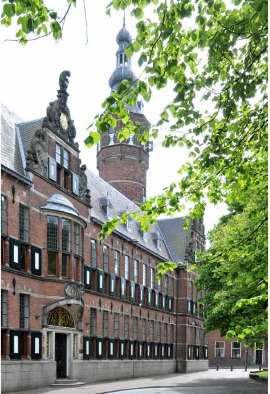
Das Provinzhaus, Martinikerhof 12