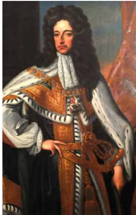
Portrait von Prinz Wilhelm III

An den Wänden hängen zwei Gemälde. Das eine ist ein unsigniertes Werk mit dem Portrait von Prinz Wilhelm I. (Wilhelm, der Schweiger) (1535 - 1584). Das andere ist ein Portrait von Prinz Wilhelm III. (14. November 1650-08. März 1702). Er war der Sohn des Stadthalters Wilhelm II. Er vermählte sich mit Maria Stuart, der ältesten Tochter König Jakobs II. von England. Wilhelm III. ist in der Eigenschaft als König dargestellt, was an dem Mantel und der Krone zu erkennen ist. Um seinen Hals hängt eine Kette mit einem Bild des Schutzheiligen von England, des Heiligen Georg mit dem Drachen. Wilhelm III. starb am 08. März 1702 nach einem Sturz von seinem Pferd. Das Gemälde wurde geraume Zeit restauriert und befindet sich erst seit Juni 2004 wieder im Provinzhaus.