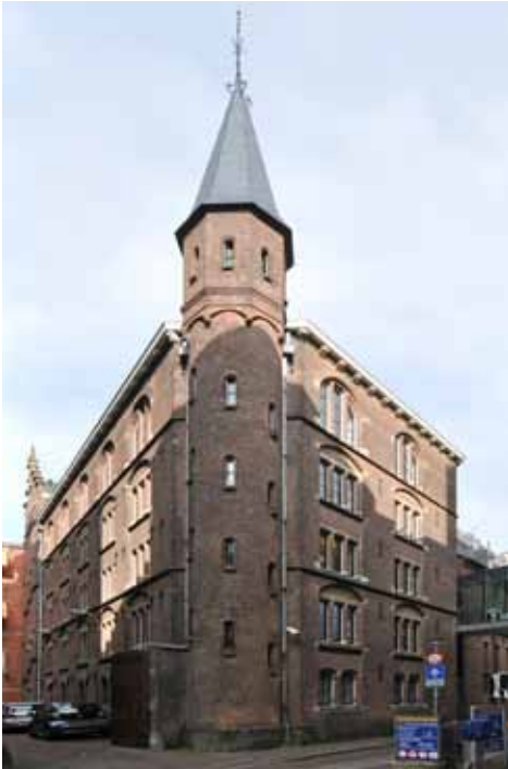
Das frühere Archiefgebäude