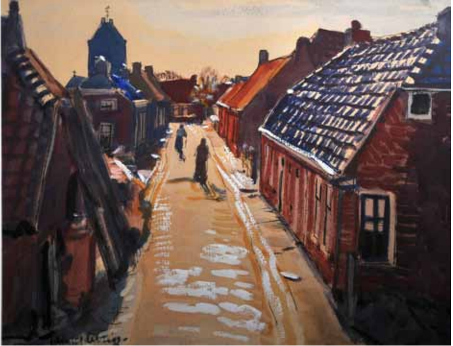
'Garwerd', 1954, Jannes de Vries