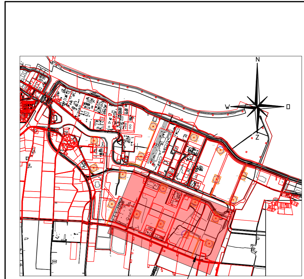
Situatie schaal 1 : 50000