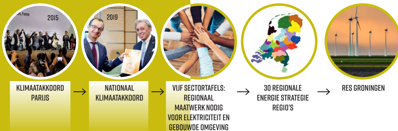
FIGUUR I: NATIONALE DOELSTELLING DUURZAME OPWEKKING ELEKTRICITEIT EN GEBOUWDE OMGEVING (7 MILJOEN WONINGEN EN 1 MILJOEN GEBOUWEN).

1,5 miljoen gebouwen aardgasloos in 2030 en alle gebouwen (8 miljoen) aardgasloos in 2050.